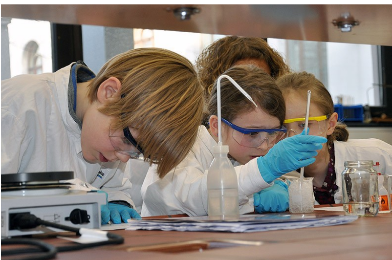
Abbildung 2: Kinder experimentieren im Agnes-Pockels-SchülerInnen-Labor der TU Braunschweig